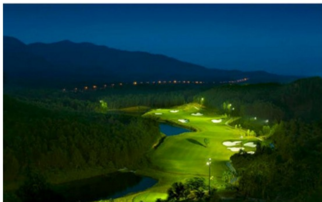
Sân Gôn Bà Nà Hills Golf Club

Bà Nà Hills Golf Club tại Đà Nẵng vừa trở thành sân gôn (golf) đầu tiên tại miền Trung khởi động hệ thống chiếu sáng toàn diện, cho phép các gôn thủ có thêm cơ hội trải nghiệm gôn vào ban đêm.